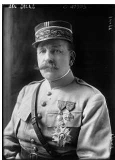
Général DUBAIL, Grand Chancelier en 1921

Approbation des statuts de la « Société de la Légion d'honneur » par le Président de la République, A. MILLERAND, qui en accepte la présidence d'honneur