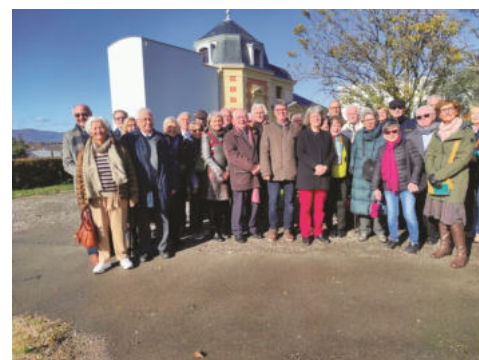
Un groupe important