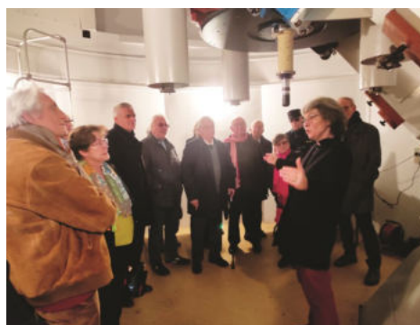
Au cœur de l'observatoire