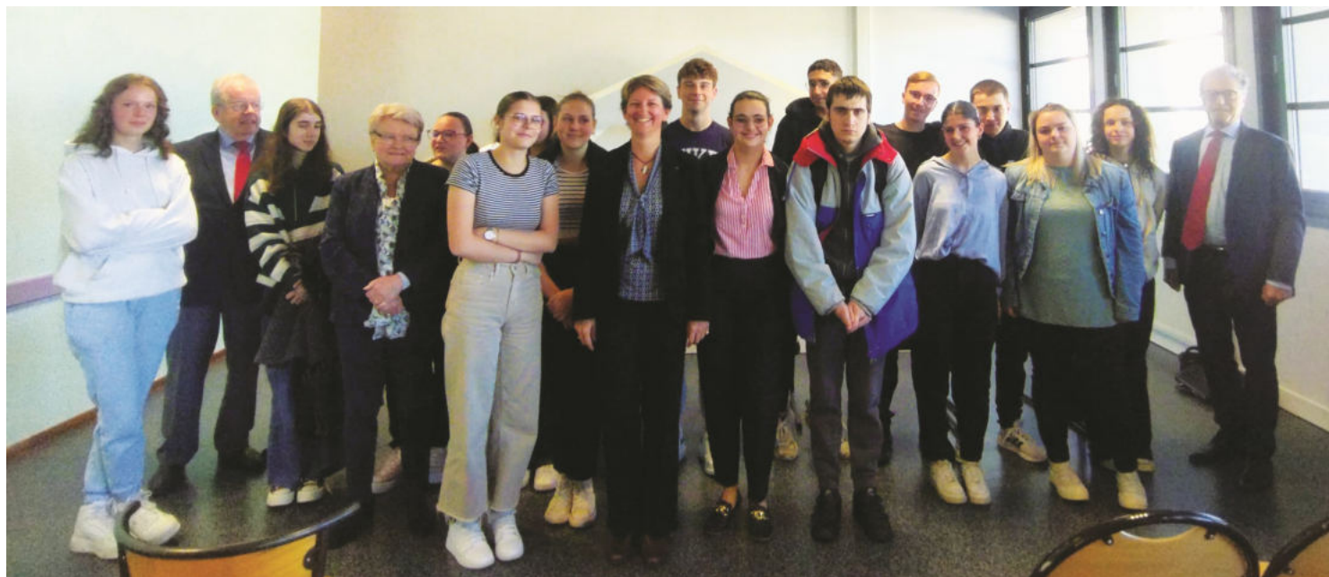
Les élèves du Lycée François Mansart avec les enseignants et les membres de la SMLH

Cette action inter-comités a été réalisée à l'initiative du Comité Lyon-Ouest, en concertation avec le comité 16 de Villefranche-Beaujolais et le Comité 15 de Tarare.