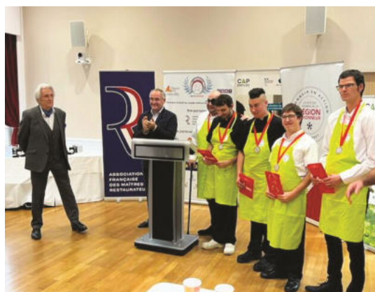
Remise du prix Cap Handicook