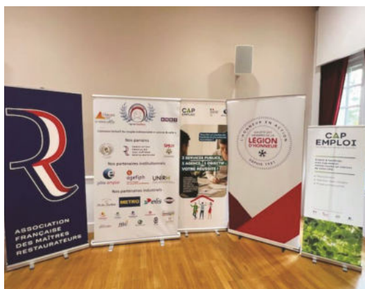
Les sponsors présents