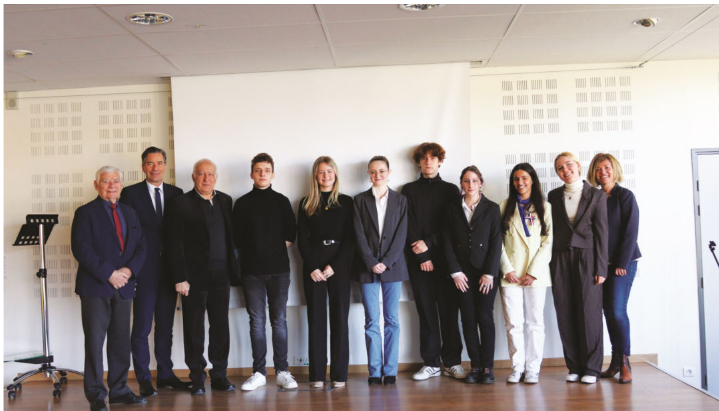
Les candidats de Villefranche-sur-Saône et leurs soutiens