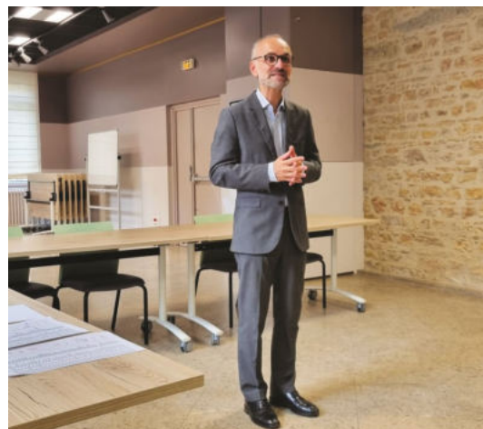
Monsieur Rémi Zinck, maire du 4 e arrondissement