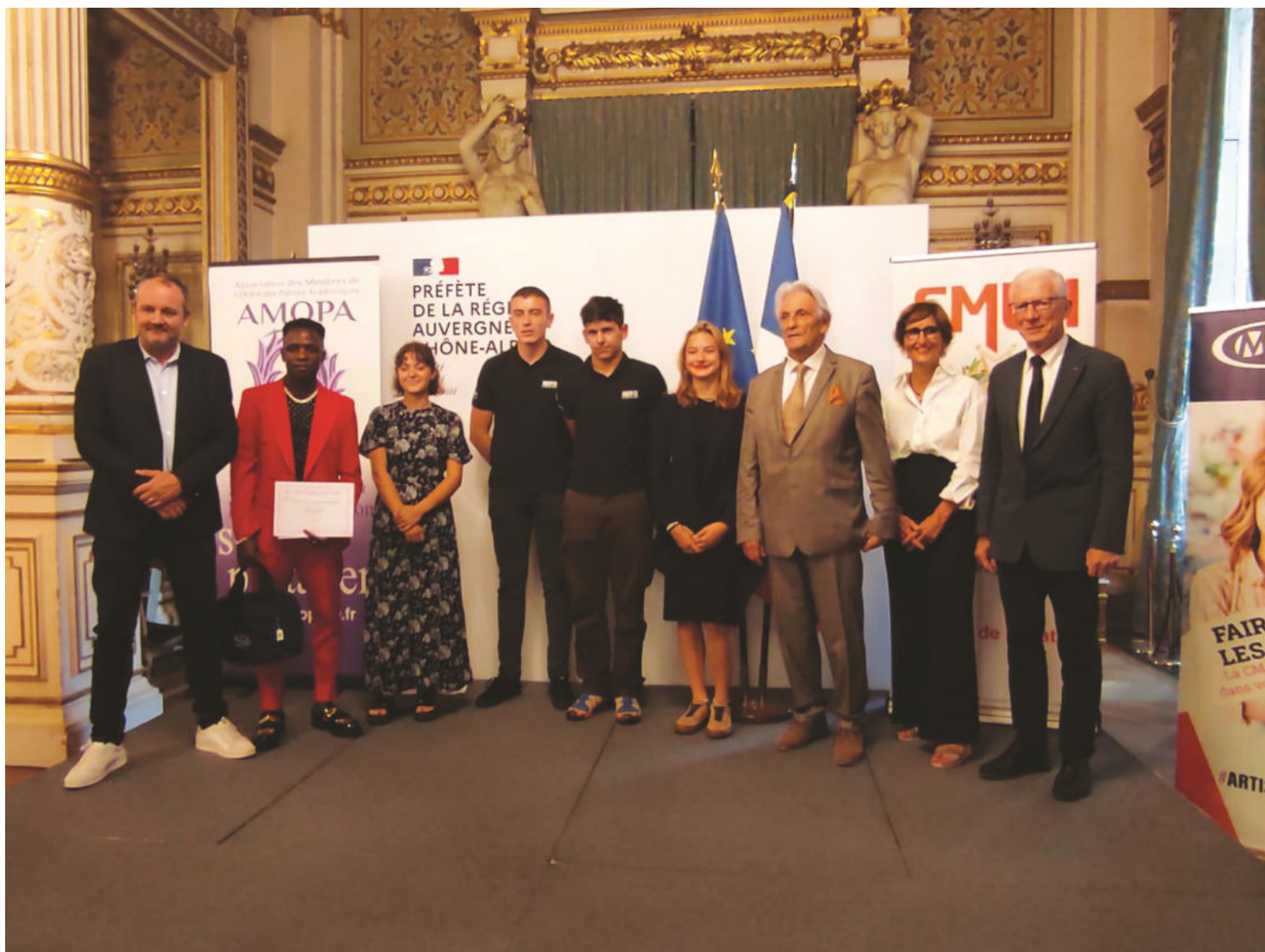
Les lauréats des prix SMLH et AMOPA réunis avec les présidents des associations

L'édition 2023 a vu notre section départementale et de la métropole de Lyon s'allier à celle de l'ordre des Palmes académiques pour le prix de l'apprentissage.