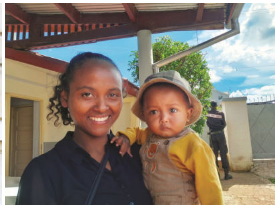
Monderine et un des jumeaux