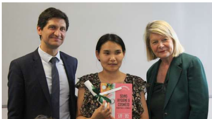
Carl Segaud, Maire de Châtenay-Malabry

Ce lieu d'échanges et de savoir, réunit des femmes aux profils variés : femmes mariées avec ou sans enfant, femmes monoparentales, femmes isolées, en recherche d'emploi, bénéficiaires du RSA, entrepreneures, diplômées ou en situation de précarité.