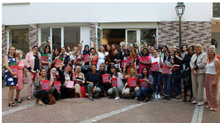
Remise des diplômes à l'Ecole Française des Femmes de Fontenay-aux-Roses, avec Laurent Vastel, Maire de la ville.