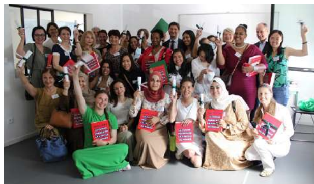
Remise des diplômes 2021 à l'École Française des Femmes de Châtenay-Malabry

Aujourd'hui l'Institut des Hauts-de-Seine compte six Écoles Françaises des Femmes , implantées dans les communes des Hauts-de-Seine suivantes : Antony, Châtenay-Malabry, Clichy-la-Garenne, Fontenay-aux-Roses, Gennevilliers et Nanterre.