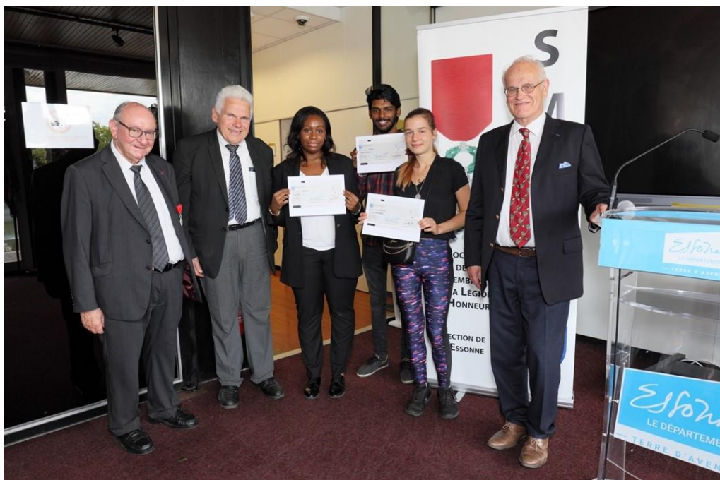
Les trois lauréats avec leurs parrains respectifs