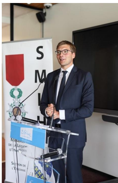
Robin REDA « Un très beau partenariat entre la SMLH et l'E2C »

Bien loin des clichés sur « les jeunes d'aujourd'hui », ces jeunes méritants développent au contraire des qualités nécessaires à leur réussite et à leur équilibre personnel permettant leur insertion dans le monde du travail et dans la société. Comme l'a développé longuement le député Robin REDA, « réussir, à nos yeux, ce n'est pas seulement avoir un job et une vie épanouie, c'est aussi avoir demain des citoyennes et des citoyens qui soient véritablement engagés personnellement dans la société et qui n'ont pas eu le sentiment à un moment donné, d'avoir été laissés au bord du chemin » . Et l'École de la 2 ème Chance doit poursuivre cette mission, que soulignent tous les intervenants. Il s'agit de « former des citoyens libres et engagés » .