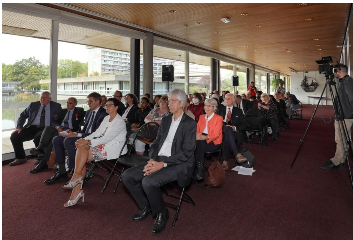
L'assistance était nombreuse autour des lauréats